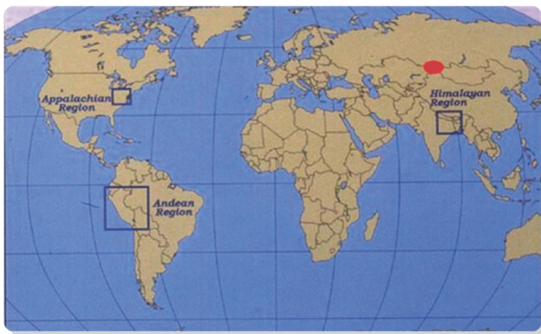
Местоположение Алтая на материке Евразия

А где же мы живем? На Востоке или на Западе?